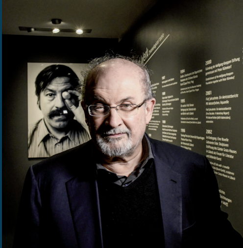
Salman Rushdie im Günter Grass-Haus.

Limitierte Auflage über 300 Exemplare aus dem Nachlass des Literaturnobelpreisträgers, nummeriert und stempelsigniert. Die Offset-Lithographie kann für 176 EUR im Museumsshop erworben werden. Tel. 0451 122 4230 / E-Mail: shop@grass-haus.de Die Einnahmen kommen dem Freundeskreis zugute.