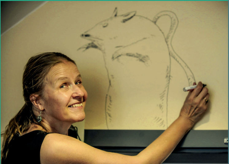
Cornelia Funke illustriert die Garderobe des Museums. © Th. Wulff