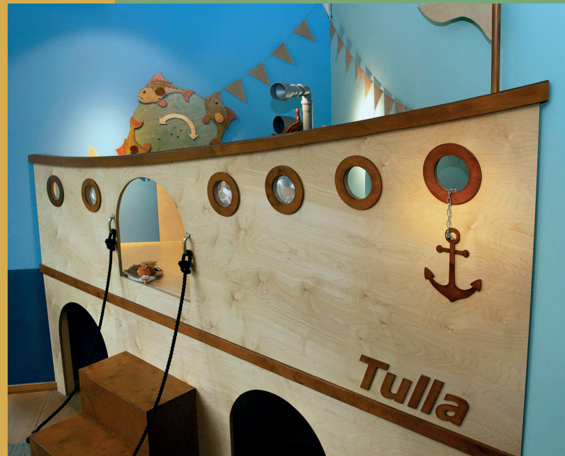
Das Holzschiff »Tulla« wartet auf seine Mannschaft!

Der Freundeskreis unterstützt die Ausstellungen, Veranstaltungen, Publikationen sowie die Bildungs- und Vermittlungsangebote des Günter Grass-Hauses.