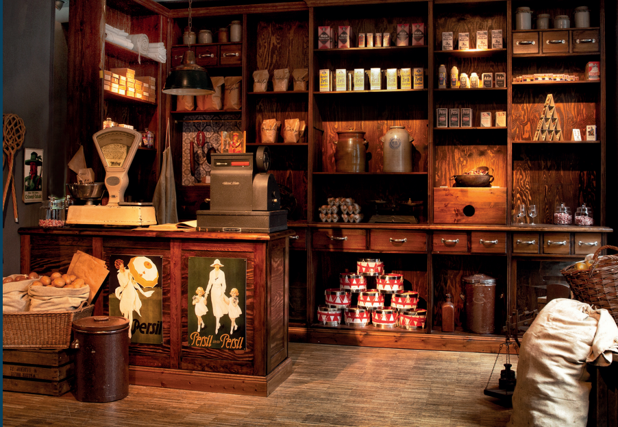
Der liebevoll ausgestattete Kolonialwarenladen lädt zum Schauen, Fühlen, Riechen und Spielen ein.